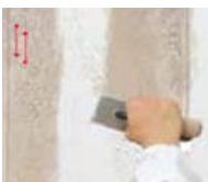
6) C100 OVER

potom použite špeciálne farebné pero PIXEL a naznačte zvisle čiary podľa požadovanej veľkosti