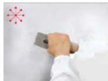
2) METEORE 10

nanášajte jednu vrstvu PRIMER 1200 riedeného vodou 15% - 20% s valčekom vo všetkých smeroch a nechajte schnúť 6 hodín pri teplote 20°C