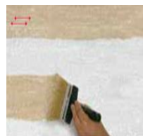
4) C100 OVER

kým je ešte povrch mokrý dekorujte celý povrch špeciálnou kefou PV105 horizontálnym smerom bez použitia produktu a nechajte zaschnúť 24 hodín