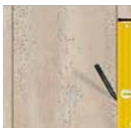
8) - PIXEL

potom naneste vrstvu neriedeného C100 OVER tónovaného do požadovaného farebného odtieňa špachtľou PV 43 v zvislých pruhoch zhora nadol