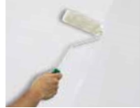
1) PRIMER 1200

nanášajte jednu vrstvu PRIMER 1200 riedeného vodou 15% - 20 % s valčekom vo všetkých smeroch a nechajte schnúť 6 hodín pri teplote 20°C