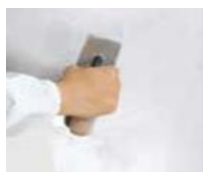
2) METEORE 10

nanášajte jednu vrstvu PRIMER 1200 riedeného vodou 15% - 20 % s valčekom vo všetkých smeroch a nechajte schnúť 6 hodín pri teplote 20°C