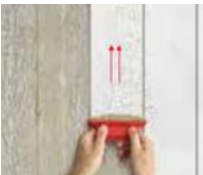
6) C100 OVER

potom použite špeciálne farebné pero PIXEL a naznačte zvisle čiary podľa požadovanej veľkosti