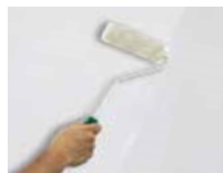
1) PRIMER 1200

nanášajte jednu vrstvu PRIMER 1200 riedeného vodou 15% - 20 % s valčekom vo všetkých smeroch a nechajte schnúť 6 hodín pri teplote 20°C