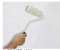
1) PRIMER 1200

nanášajte jednu vrstvu PRIMER 1200 riedeného vodou 15% - 20 % s valčekom vo všetkých smeroch a nechajte schnúť 6 hodín pri teplote 20°C