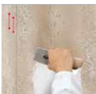
7) C100 OVER

potom naneste vrstvu neriedeného C100 OVER tónovaného do požadovaného farebného odtieňa špachtľou PV 43 v zvislých pruhoch zhora nadol