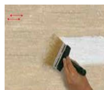
5) C100 OVER

potom naneste vrstvu C100 OVER tónovaného do požadovaného farebného odtieňa riedeného vodou 10 % štetcom PV v horizontálnych pruhoch