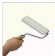
1) - Primart 600

naneste vrstvu PRIMART 600 riedeného s 15 - 20% vody. Počkajte 4 hodiny pri teplote pri 20 ° C.