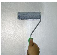
3) - Sabulador Soft

prejdite celý povrch, kým je ešte mokrý kefkou PV 88 alebo PV 89, pohybmi zhora nadol a naopak zanechávajúc čo najviac rovnomerné ryhované pásy. Nechajte zaschnúť 2 hodiny pri teplote pri 20 ° C.