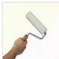
1) - Primart 600

naneste vrstvu PRIMART 600 riedeného s 15 - 20% vody. Počkajte 4 hodiny pri teplote pri 20 ° C.