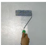
2) - Sabulador Soft

naneste vrstvu PRIMART 600 riedeného s 15 - 20% vody. Počkajte 4 hodiny pri teplote pri 20 ° C.