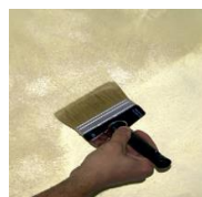
3) - Sabulador Soft

aplikujte SABULADOR SOFT pomocou štetca PV 09 všetkými smermi. Nechajte zaschnúť približne 2 hodiny pri teplote 20 ° C.